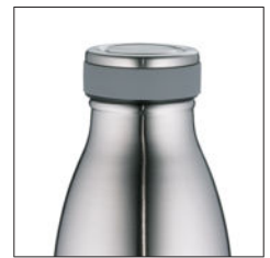
gummierter Drehverschluss rubberized screw lid