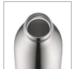
kein Plastik berührt das Getränk no plastic touches drinks